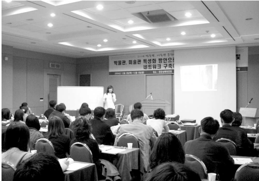
박물관·미술관 실무자 워크숍