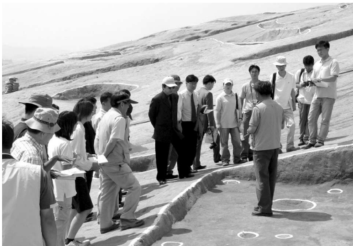
기전문화재연구원 매장문화재 발굴현장

기전문화재연구원의 사업은 문화재 학술조사와 전통문화의 계승과 연구로 대별되며, 학술조사는 다시 지표조사와 발굴조사로 성격이 구분된다. 지표조사는 문화재 조사의 초기 작업으로서 사업면적 3만 제곱미터 이상의 건설공사 또는 문화재