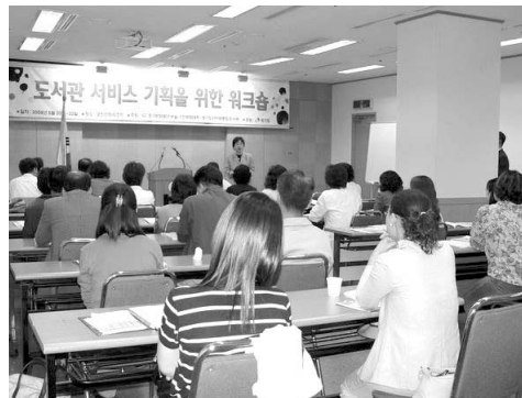
(좌)어린이 문화창조학교 도움