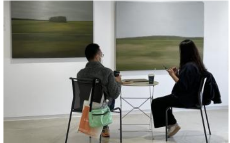
▲ 2021 아트경기 팝업갤러리 <업클로즈 02>(안다즈 호텔), <업클로즈 03>(플랫폼 엘)