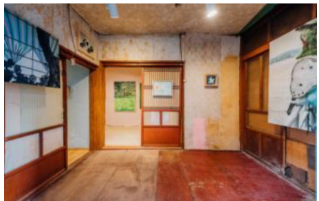
▲ 2021 아트경기 미술장터 <신장동 할로윈 아트 마켓> (평택국제시장 내)