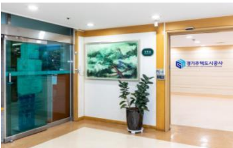
▲ 경기주택도시공사 본사(수원)