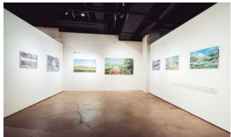
▲ 2021 온라인 사업(제휴) <아트경기x오픈갤러리>