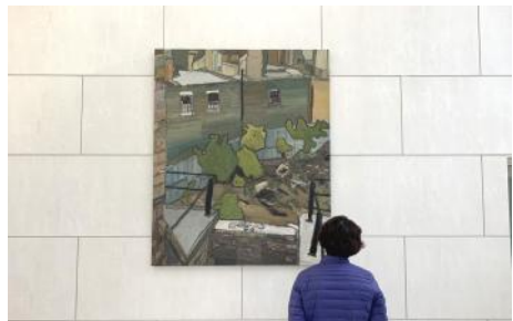
▲ 시흥 배곧1동 행정복지센터(시흥)