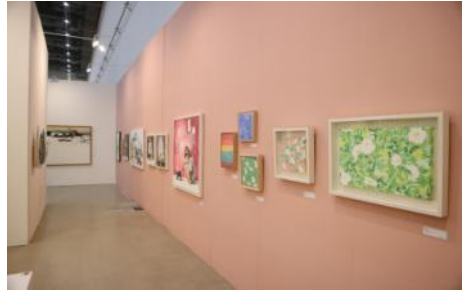
▲ 2021 아트페어 참가 <대구아트페어 부스전> (대구 EXCO)