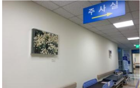
▲ 국립의료원 파주병원(파주)