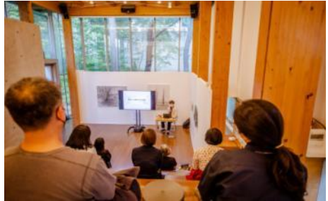
▲ 2021 아트경기 미술장터 <아트경기x아트로드77> (파주 헤이리 예술마을)